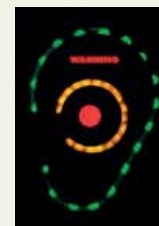
Rött inneröra + VARNING

Ljudnivån närmar sig det förinställda gränsvärdet - sänk ljudnivån