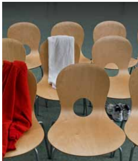
FRISKA TAG. Med koll på hälsoläget bland de anställda är det lättare för företagen att förbättra.