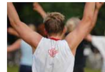
FÖRBEREDD. F&S Stockholm värmer upp löparna innan start.

För att finansiera verksamheten anordnas Kistaloppet, ett lopp på 10 kilometer som delvis går genom Kistagallerian. F&S Stockholm står för uppvärmningen. Kistaloppet äger rum 18 september. Pris: 200 kronor. Anmäl dig på www.kistaloppet.se