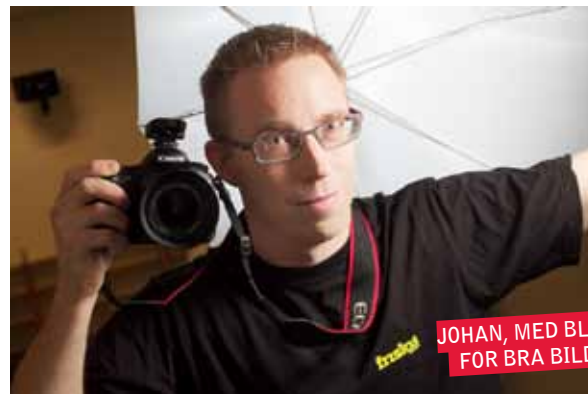
JOHAN, MED BLICK FÖR BRA BILDER