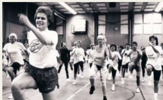
Gå på stället. Så kunde det se ut på ett jympapass från 1994.