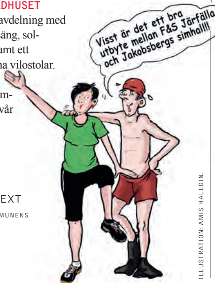
ILLUSTRATION: AMIS HÄLLDIN.

PIA TORNDAHL, TEXT (INFORMATION FRÅN KOMMUNENS HEMSIDA)