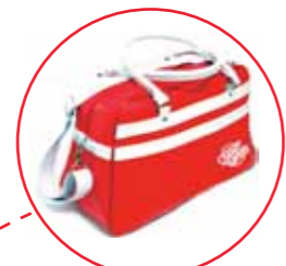
Tipsa oss och vinn en snygg väska!