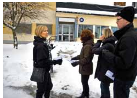
PLANERING Bakom den här dörren kommer 100-tals motionärer att kunna svettas i oktober

Text: Lotta Westberg