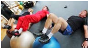
TMI-trio. En allt vanligare syn.

Vårens passnyheter var Dans fuego, IntervallFlex, Flex & HIT. Under året tillkom dessutom Cirkelgym senior och uteutbudet utökades med Jogging och Cross/bas. Sen kom TMI, som står för Träna med instruktör och som finns i tre olika nivåer: Grund med en twist, Fortsättning, samt Intensivt och utmanande. Årets nära-döden-upplevelse står HIT för. HIT, högintensiv träning, är F&S allra tuffaste pass där du kan utmana både kondition och styrka till max.