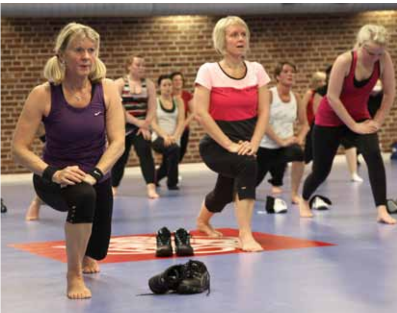
FLEX30 är ett pass som kan kombineras med andra träningspass

Stavgång innebär en timmes uppvärmning, teknikträning, kondition, rörlighet och nedvarvning. Passet leds av en entusiastisk och drivande ledare ute i naturen oavsett väder. Stavgång gör att du kommer åt de stora muskelgrupperna i ben, rygg, mage, armar och axlar – samtidigt som du får starkare hjärta! Genom att gå med rätt teknik kommer du att öka pulsen och träningseffekten med 40 %. Stavarna aktiverar även musklerna i axelpartiet och ryggen, vilket är extra bra för kontorsnissar. Målgruppen är alla typer av motionärer, men ledaren individanpassar träningen utifrån motionärens nivå. Stavgång är en social träningsform som ger positiv energi i grupp. Ett bra sätt att komma igång med träning.