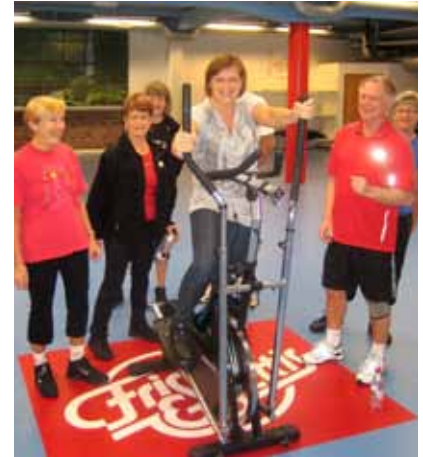
GLADA MINER från blivande walkare.

Bosu, som är förkortning på "both sides up", är en boll/balansplatta i ett och samma redskap. Bosun kan användas från båda håll och har ett brett användningsområde inom gruppträning, individuell träning och rehab. För att träna balans och stabilitet är bosun ett perfekt redskap, den "halva" bollen möjliggör många bra utgångspositioner på golvövningar och är också bra att använda som rörligt underlag i stående. Balansplattesidan ger inspiration till många utmanande övningar som blir rejält vingliga och därmed bra balans- och koordinationsträning. I Friskis&Svettis träning använder vi bosun i bl.a Core bosu, Cirkelfys och i individuell träning i gymmet. Core bosu vänder sig till en bred målgrupp, alla som vill träna balans, hållning, styrka och stabilitet. Det går att anpassa nivån på passet bl.a utifrån de övningar och de balanskrav vi väljer. Därför är passet inte knutet till någon nivå eller intensitet. Karaktären på bosupasset är "sportigt" och "träningfokuserat". Passet skall också inspirera till att använda tekniker och färdigheter i vår vardag och annan träning. Därför väljer vi funktionella övningar som förbättrar och stärker våra naturliga rörelsemönster.