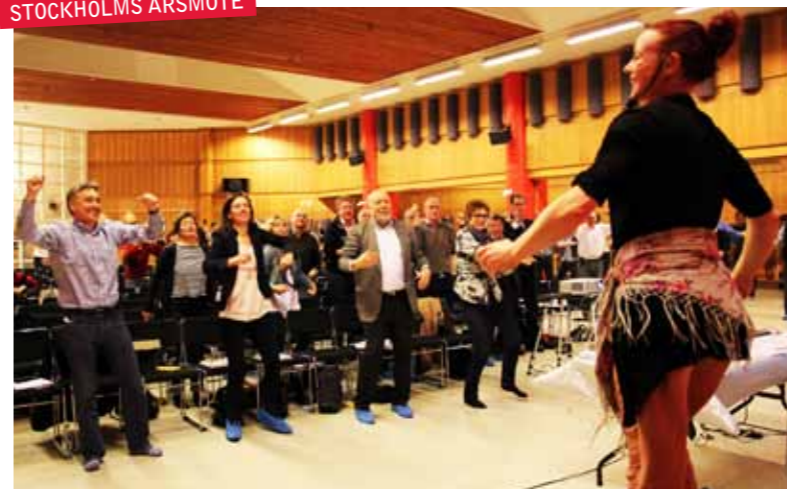
OVÄNTAT. Det hettade till på F&S City när årsmötet rycktes med i träningsnyheten Dans fuego.