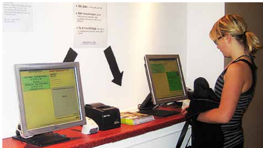
INCHECKNING Tryck på passen på skärmen. Sätt ditt kort med pinkoden under läsare. Ta incheckningskvittot.

SAL HAV , pass som inte är bokning på, tar 55 personer.