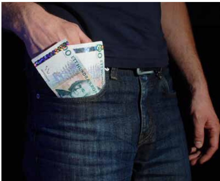
MÅLET ÄR ETT LEENDE. Pengarna försvinner inte ner i någons ficka.

Frågan många kanske ställer sig är vart pengarna till medlemsavgiften och träningskortet tar vägen. Friskis&Svettis är en ideell förening. Pengarna får alltså medlemmarna tillbaka i form av bland annat förbättrade träningsmöjligheter och träningsredskap.