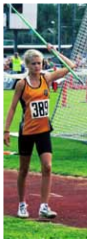
VANILLE klass 8b på Nyhamnsskolan

Mina två praoveckor på Friskis&Svettis har varit riktigt kul!