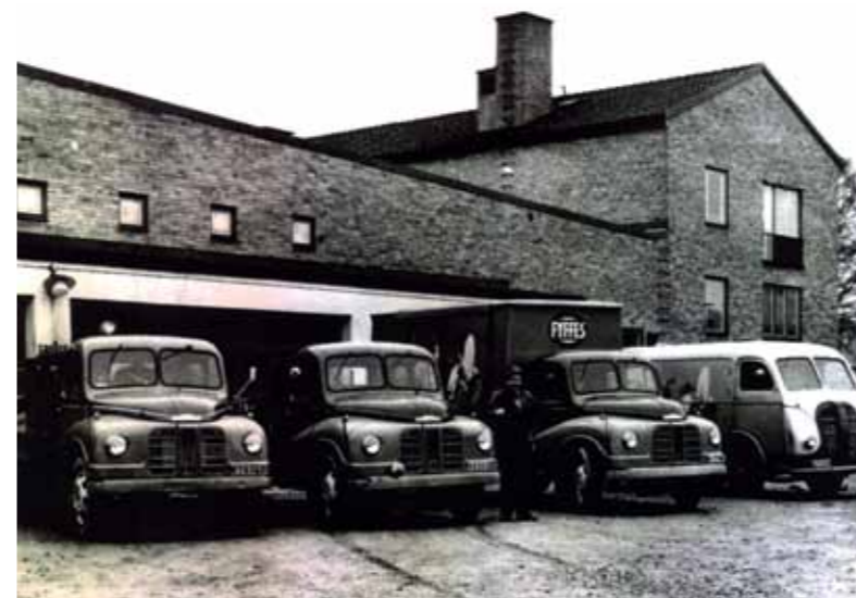
BJÖRNÖVÅGEN DÅ DET BEGAV SIG. Fotot är taget någon gång i början av 50-talet då byggnaden användes som lager. Företaget som huserade här då hette Rudhes & Co.

FRISKIS&SVETTIS VÄXTE så det knakade och blev snart trångboddade. Lokalgruppen fick åter ut och leta efter lokal. Bland annat så gjordes det en hopptest i gamla Samhalls lokal, rakt över gatan. När över hundra personer hoppar i takt under ett jympapass blir det stora påfrestningar på byggnader. Så var fallet med lokalen där testet visade att huset skulle sättas i gungning med en stor rasrisk som följd. Lösningen på trångboddheten kom först när Lantmännen sålde Björnövågen och alla hyresgäster flyttade ut, utom Friskis&Svettis.