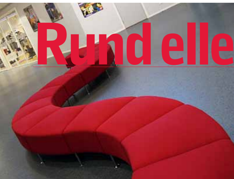
KURVIG. Vår önskan är att du ska trivas lika mycket hos oss som hemma. Att F&S Sollentuna blir ditt andra vardagsrum. Fast rörligare och svettigare.