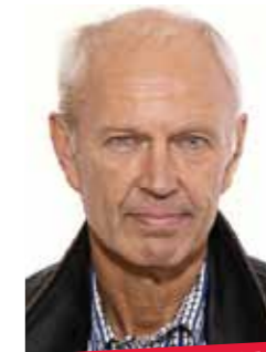
PIERRE SCHORI, DIPLOMAT OCH EXPOLITIKER

→ Anmälan: Från 21 februari via telefon till 08-429 70 14