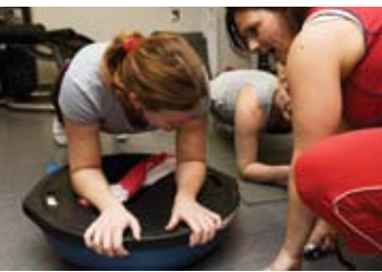
PLANKAN PÅ VINGLIG BOSUBOLL. Instruktören peppar och hejar på.

Rummet är litet , som ett vardagsrum, med lågt i tak och lysrör. Längst väggarna står gymmaskiner två och två. De ser annorlunda ut, enkla och avskalade i konstruktionen.