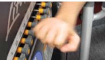
KNAPPARNA bestämmer motståndet. Ju fler intryckta desto tyngre.

Sen börjar cirkelträningen. Två deltagare vid varje station. Det är 16 stationer så passet tar max 36 personer. När alla är på plats sätter musiken i gång – högt, här finns inget elektroniskt öra. I 45 sekunder är det fullt ös. Så tystnar